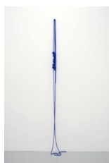
Franziska Furter Trap/Bay , 2018 Nylon Seil 234 x 27 x 22 cm (FF218.09) CHF 4,200