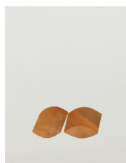
Mamiko Otsubo Untitled (Copper eyes extruded) , 2017 Metall Klebefolie auf Mylar 35.6 cm x 27.9 cm (MO217.01) CHF 2,200