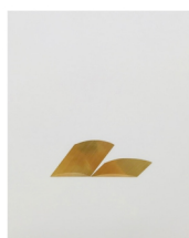
Mamiko Otsubo Untitled (Brass eyes halved) , 2017 Metall Klebefolie auf Mylar 35.6 cm x 27.9 cm (MO217.03) CHF 2,200