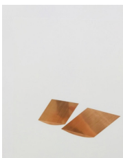
Mamiko Otsubo Untitled (Copper eyes halved and flipped) , 2017 Metall Klebefolie auf Mylar 35.6 cm x 27.9 cm (MO217.04) CHF 2,200