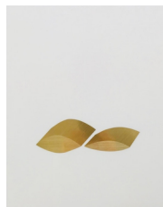
Mamiko Otsubo Untitled (Brass squint extruded) , 2017 Metall Klebefolie auf Mylar 35.6 cm x 27.9 cm (MO217.02) CHF 2,200