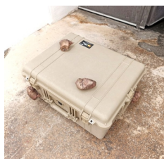
Benedikte Bjerre Done Thing , 2022 Direkter Bronzeguss von Babywindeln montiert auf luftdichtem Pelicase 37 x 62 x 53 cm (BB222.02) CHF 10,000