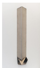
Benedikte Bjerre Reproduction , 2022 Aluminium, geschweisst 107 x 20 x 20 cm (BB222.04) CHF 6,800