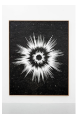
Franziska Furter With Or Without You , 2022 Tusche auf Papier 200 x 160 cm