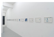
Franziska Furter Ripples 1-30 , 2022 Tusche auf Papier je. 20 x 30 cm