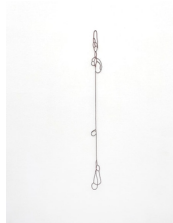
Franziska Furter Atoms of Delight 3 , 2021 Glasperlen, Nylon 130 x 10 x 5 cm