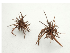
Franziska Furter Small Fires 4 - 5 , 2022 Eisen, Magnet 19 x 27 x 25 cm; 29 x 26 x 26 cm