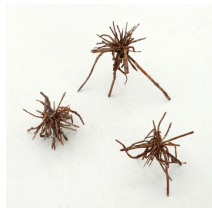
Franziska Furter Small Fires 1 - 3 , 2022 Eisen, Magnet 16 x 19 x 18 cm; 24 x 32 x 19 cm; 19 x 23 x 16 cm