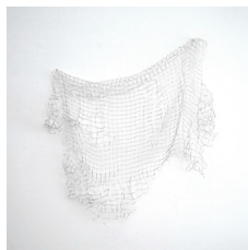
Franziska Furter Waveland/Tukutuku , 2022 Glasperlen, Nylon 100 x 94 x 15 cm