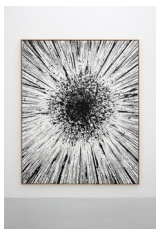
Franziska Furter A Case Of You , 2022 Tusche auf Papier 200 x 160 cm